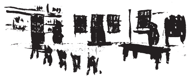
Bühnenbild 1967 Gerhard Hauptmann "Der Biberpelz", Aula Interlaken, Gerichtssaal (Grundriss, Frontsicht, Aquarell-Entwurf)