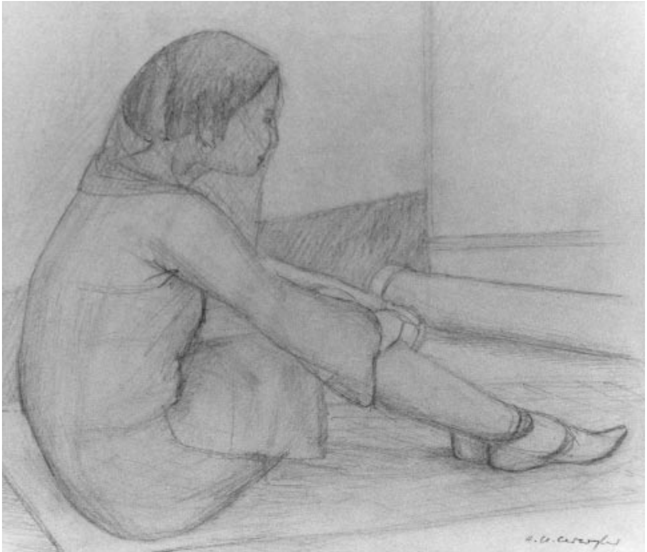
„Pakistanerin II“, Bleistiftzeichnung, 18 x 20 cm, 1972