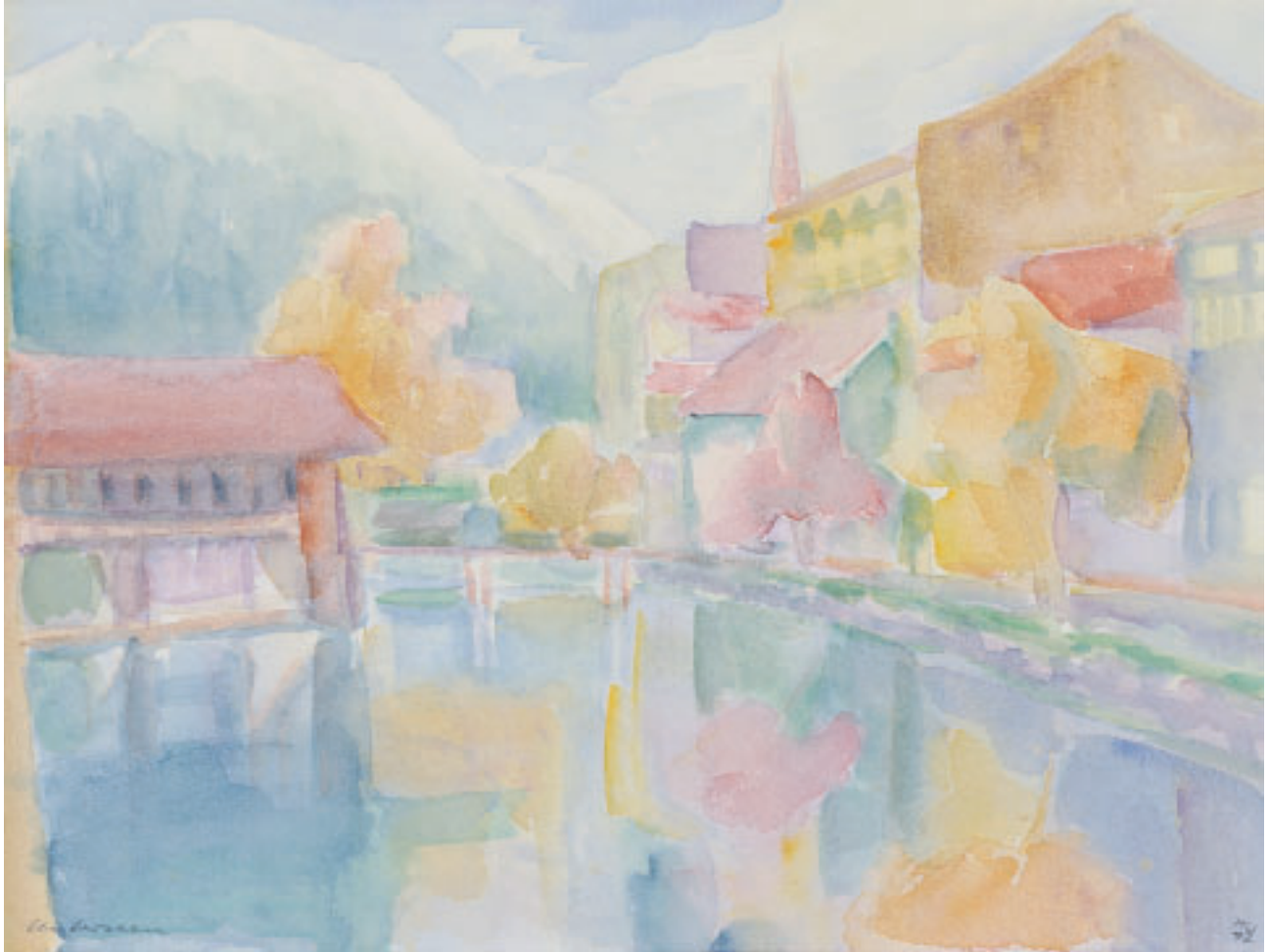
„Herbst in Interlaken“, Aquarell, 21 x 30 cm, 1970