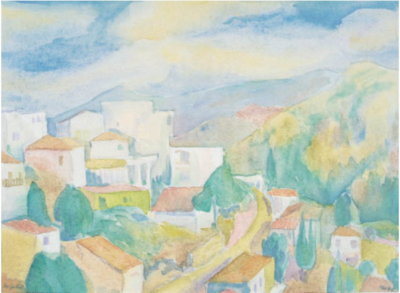
„Delphi“, Aquarell, 21 x 30 cm, 1972