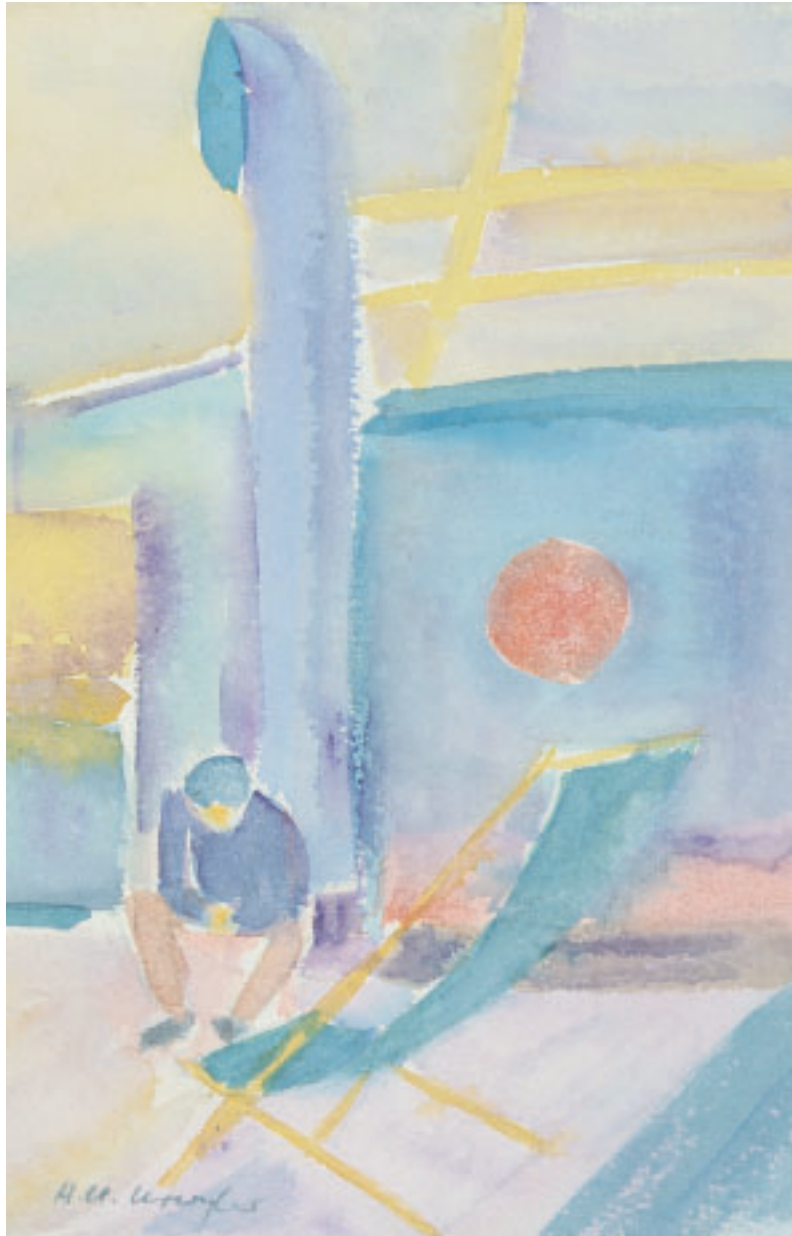
„Überfahrt nach Patras“, Aquarell, 38 x 31 cm, 1972