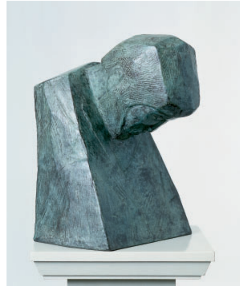
Hansueli Urwyler Bilder + Skulpturen