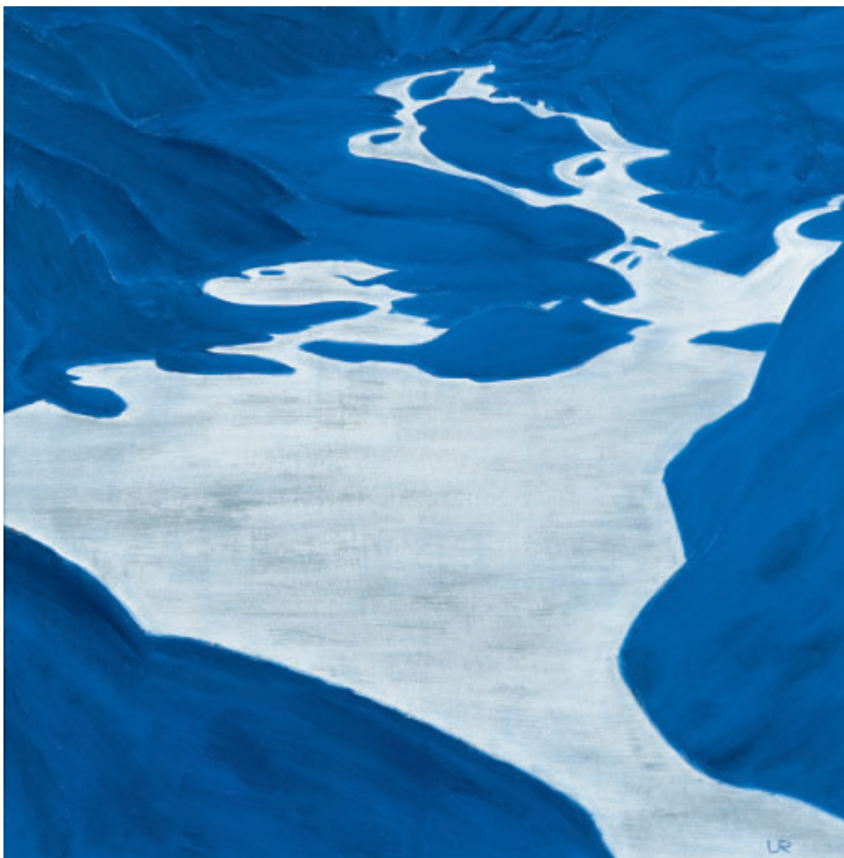
„Silberquell I“, (Grimselfass), Acryl, 100 x 100 cm, 1995