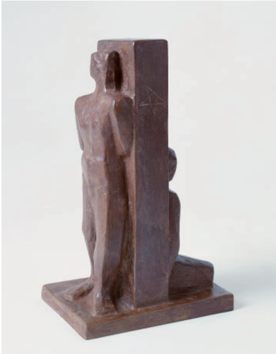
„Gefangene“, Bronze, 36 x 16 x 21 cm, 1997