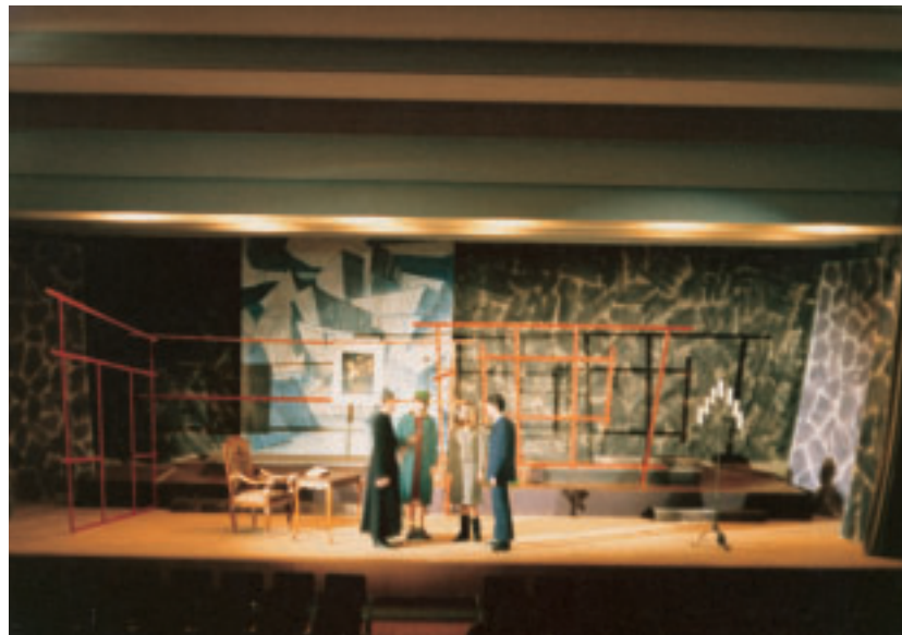
Theaterfoto Carl Zuckmayer "Der Gesang im Feuerofen", 1966 Bühnenbild Hansueli Urwyler, Aula Interlaken