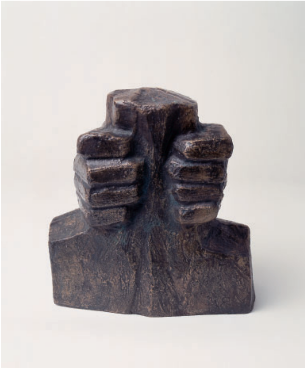
„Gewalt“, Bronze, 25 x 23 x 17 cm, 1994