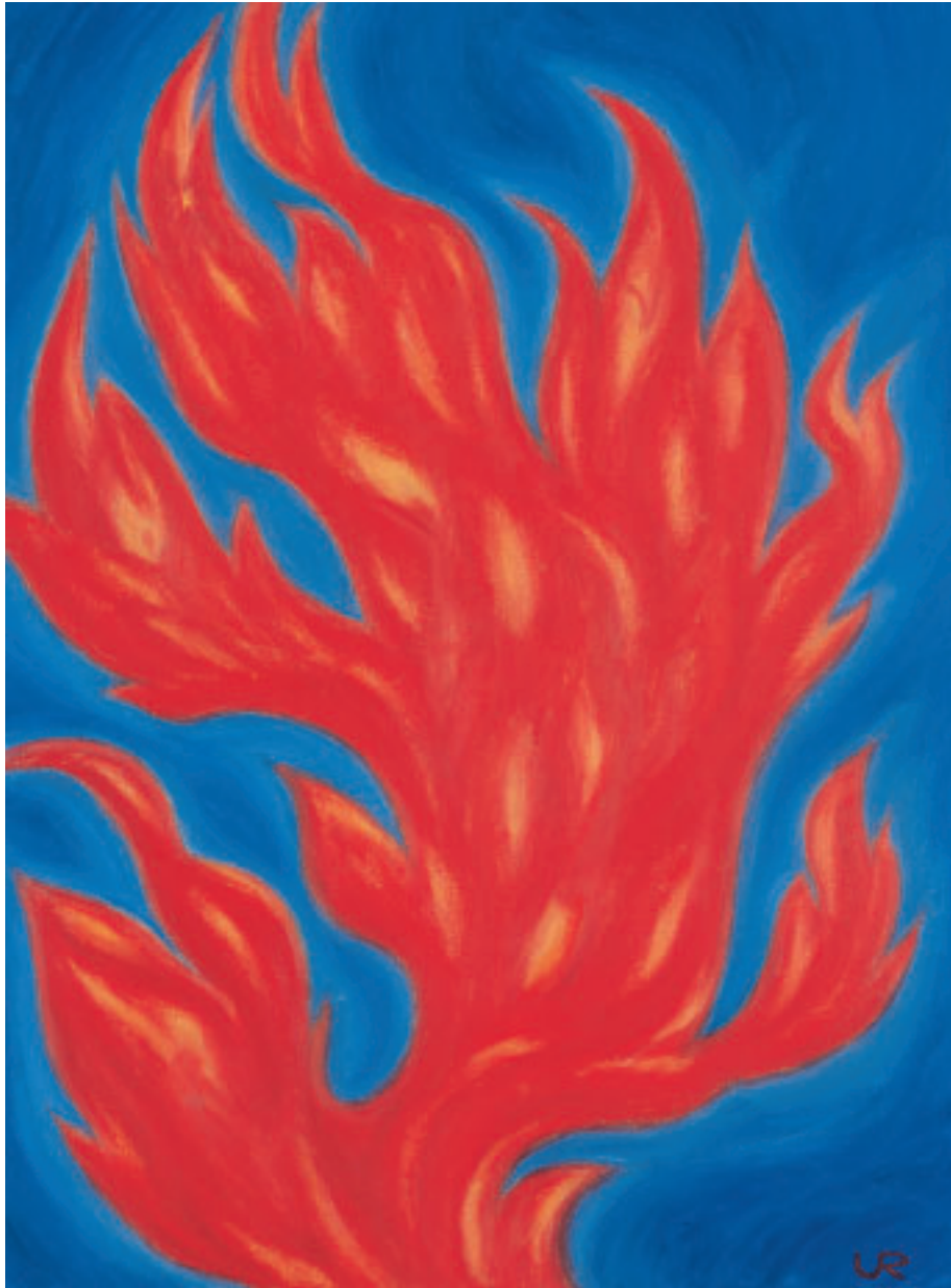
„Feuer I“, Öl, 73 x 54 cm, 1993