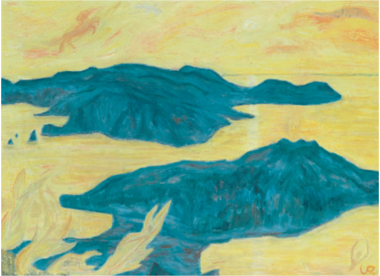
„Vision Schwefelschwaden Mte. Vulcano I“ (Liparische Inseln), Öl, 54 x 73 cm, 1981