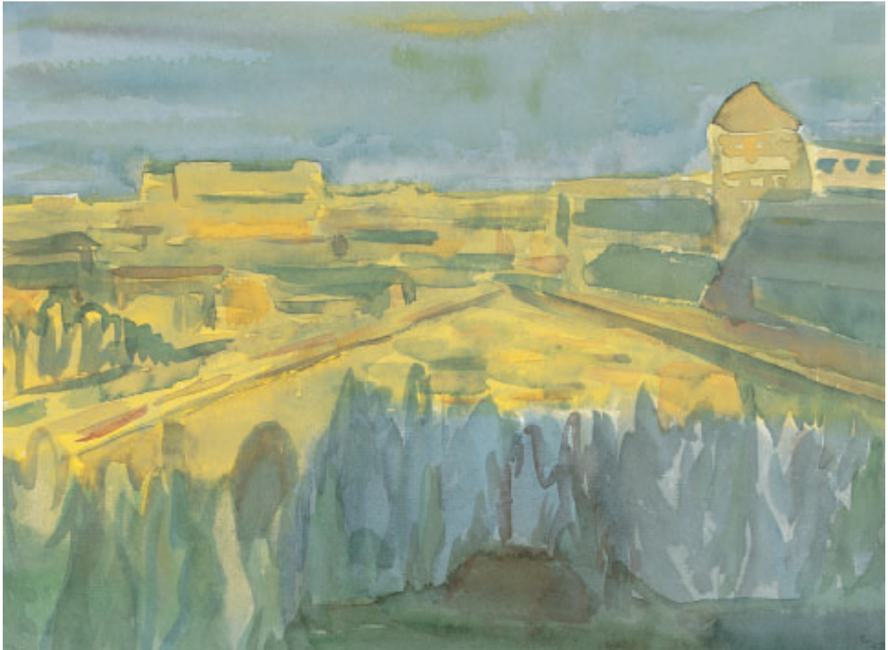
„Herbst in Bern“, Aquarell, 22 x 29 cm, 1972