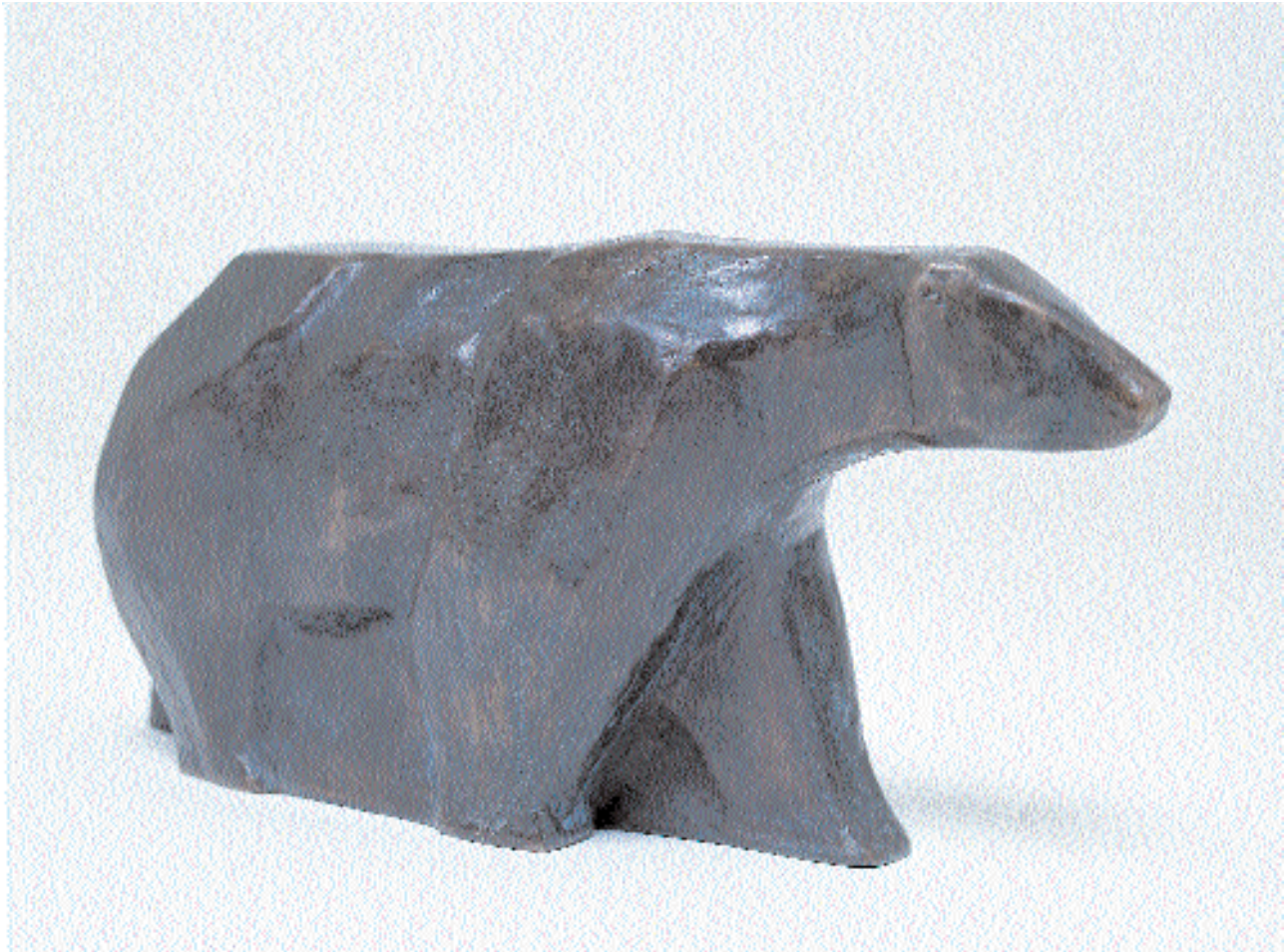
„Eisbär“, Bronze, 15 x 29 x 10 cm, 1999