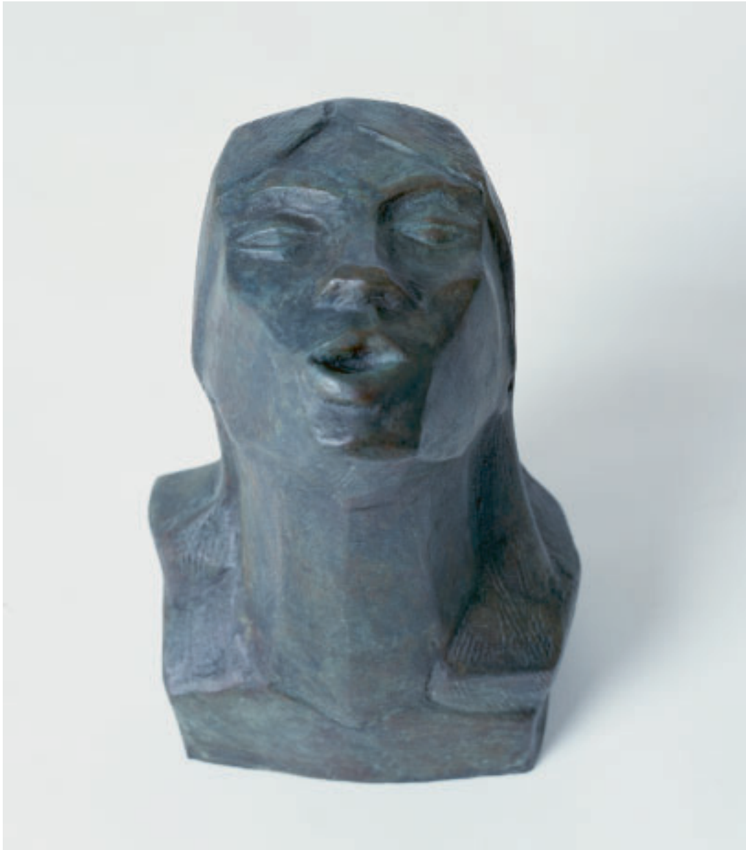
„Schmerz“, Bronze, 28 x 20 x 19 cm, 1996