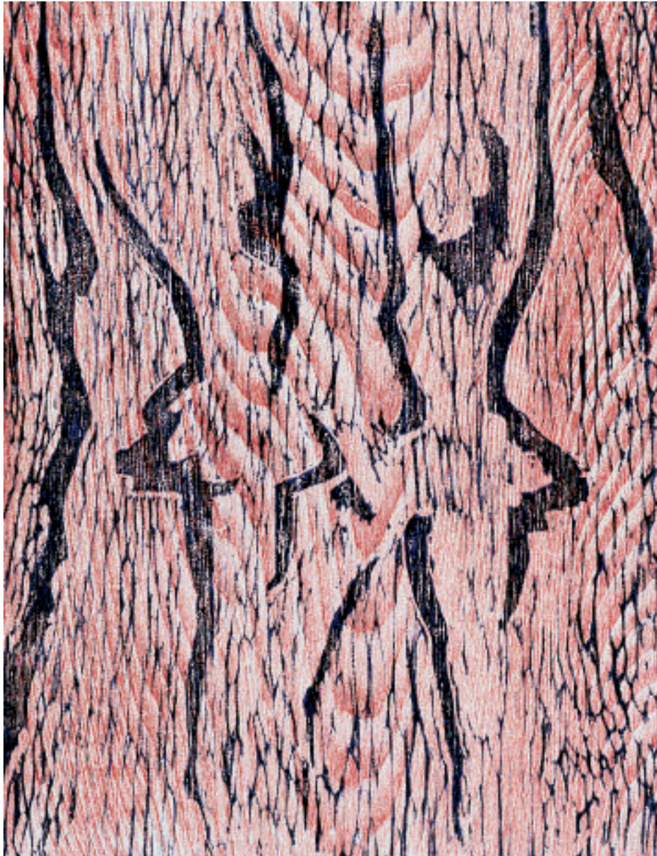
„Feuertänzerinnen“, Holzschnitt, 43 x 33 cm, 1989