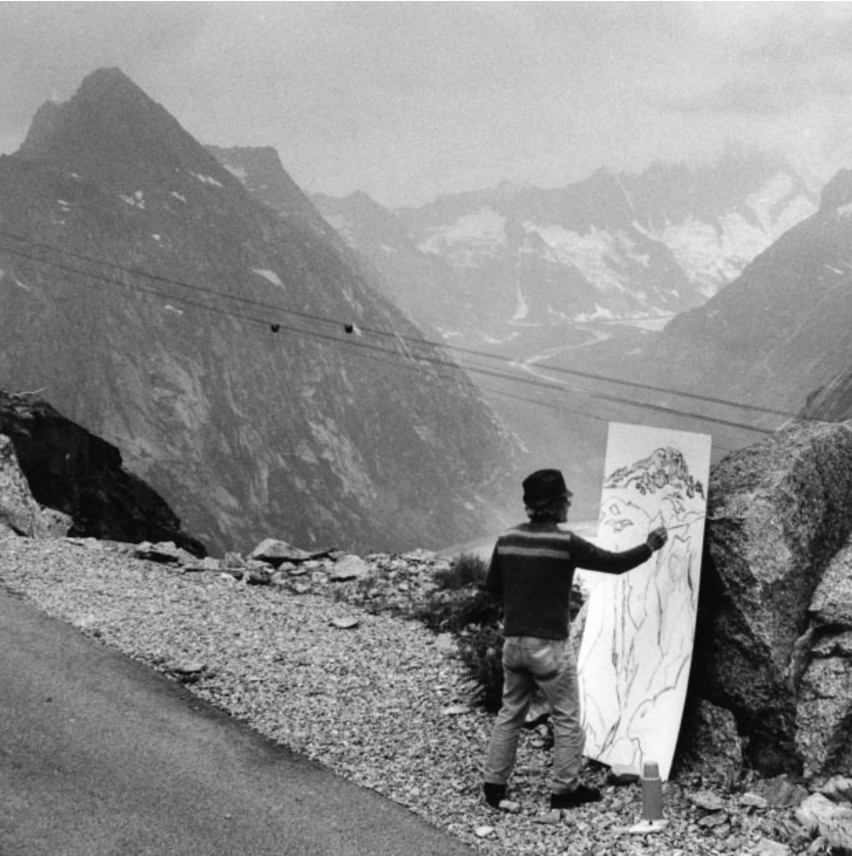
Hansueli Urwyler · Bilder + Skulpturen