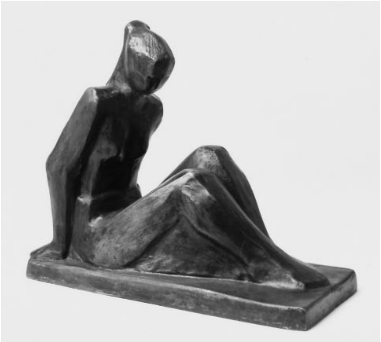
„Ruhende Frau“, Bronze, 26 x 31 x 14 cm, 1994