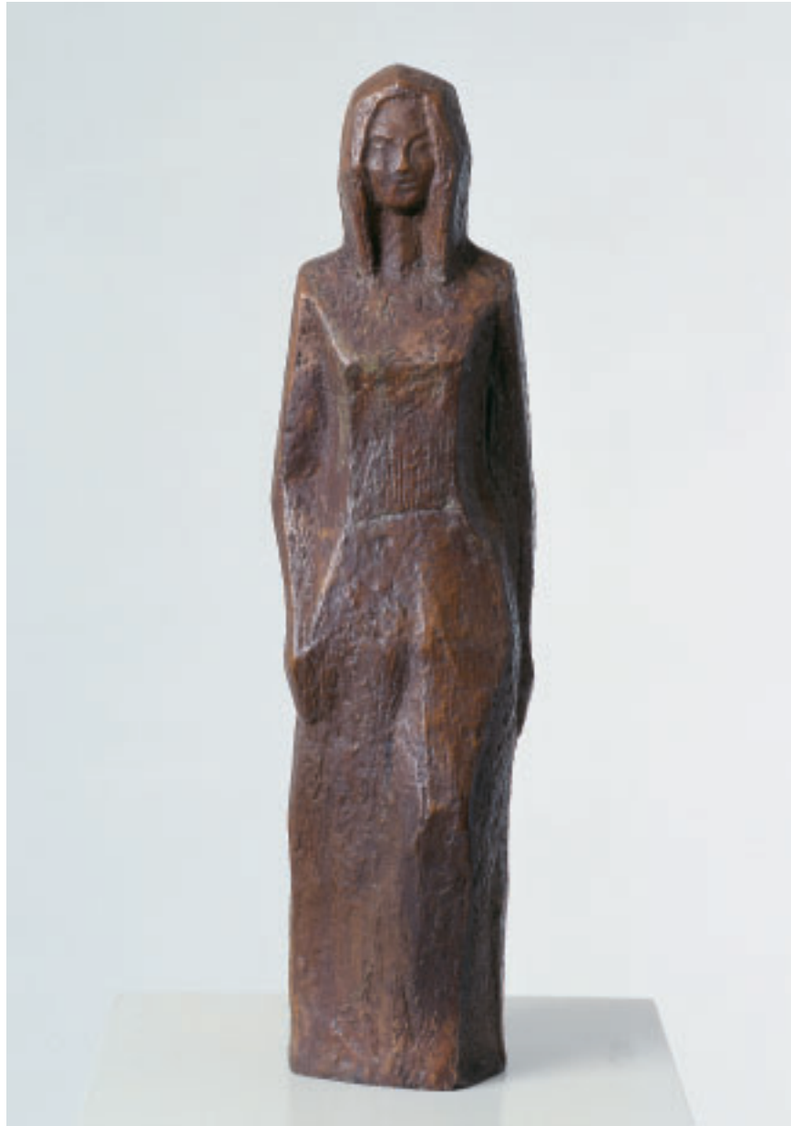
„Junge Frau“, Bronze, 42 x 10 x 8 cm, 1997