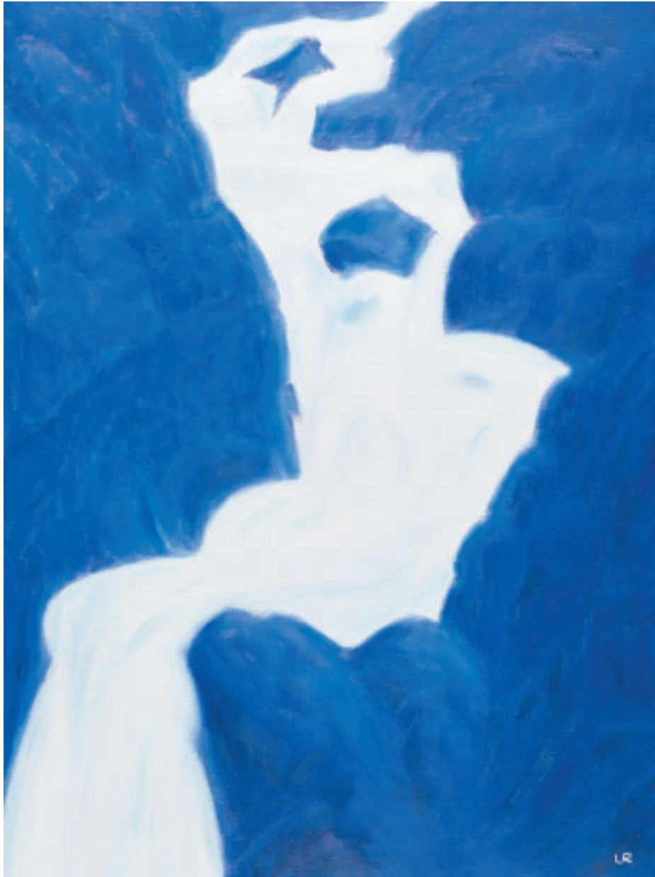
„Silberfall II“, (Grimsepass), Öl, 80 x 60 cm, 2001