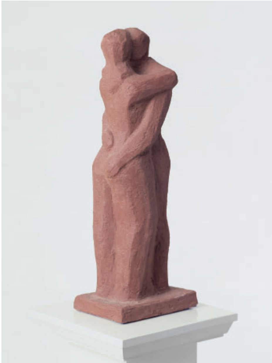
„Die Liebe“, Bronze, 45 x 16 x 12 cm, 1996