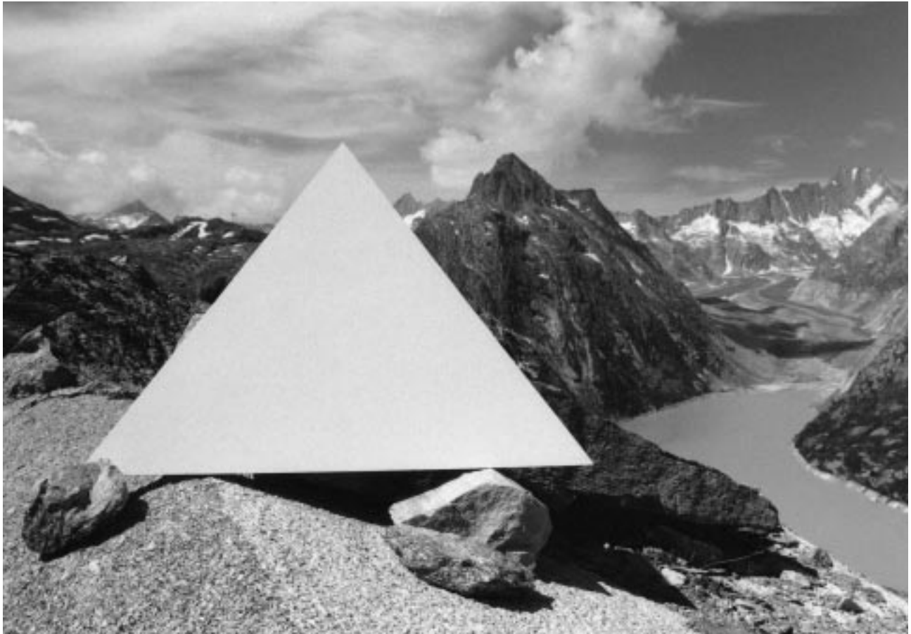
Installation „Grimselaltar“, Ausschnitt, 1995