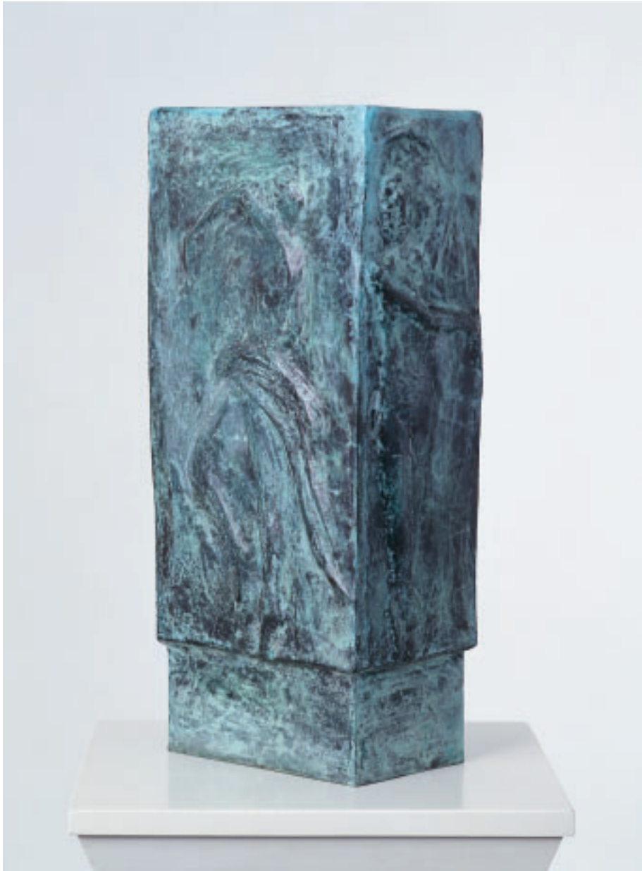
„Flamenco“ (Nina Corti), Bronze, 34 x 16 x 11 cm, 1997