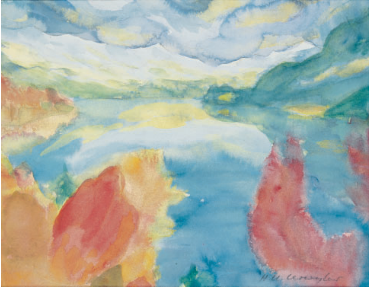
„Herbst am Brienzersee“, Aquarell, 19 x 25 cm, 1979