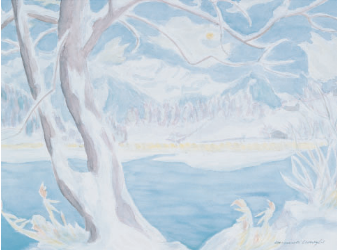
„Winterfeen Burgseeli“, (Interlaken), Aquarell, 23 x 31 cm, 1988