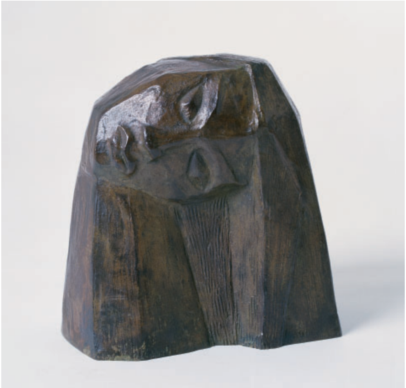
„Der Traum“, Bronze, 23 x 24 x 17 cm, 1996