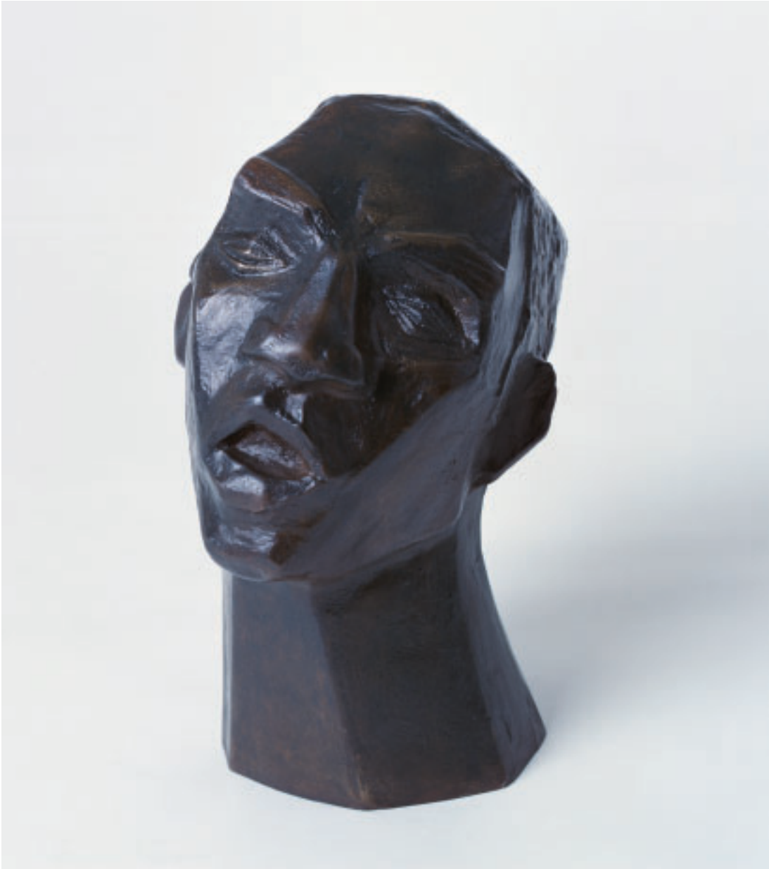
„Singender Afrikaner“, Bronze, 31 x 17 x 23 cm, 1992