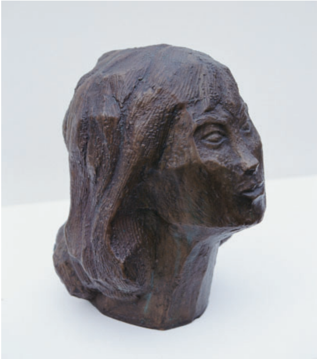
„Zuversicht“, Bronze, 30 x 28 x 19 cm, 1995