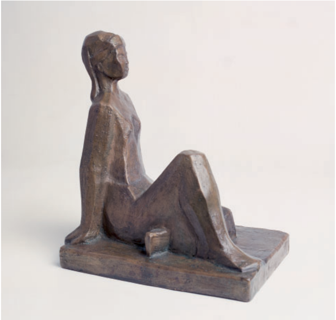
„Junge Frau“, Bronze, 30 x 28 x 19 cm, 1995