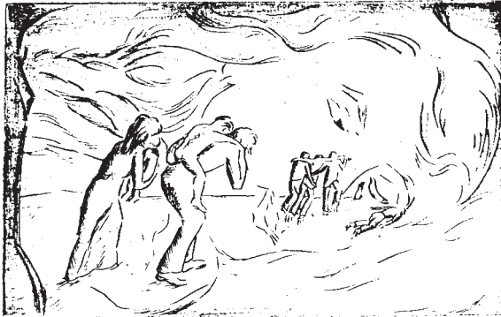
„Vision der Flucht“, Kaltnadelradierung, 19,5 x 30 cm, 1987