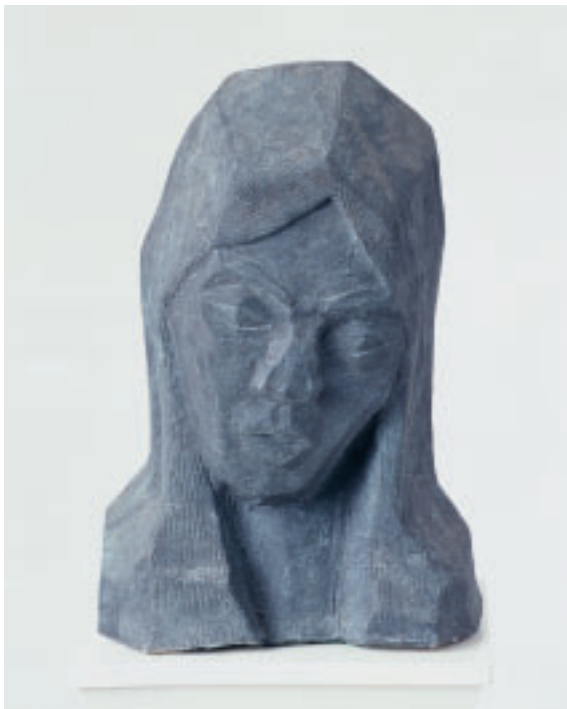
„Die Botschaft“ (Südafrikanerin), Bronze, 32 x 22 x 22 cm, 1998

Quälen dich tausend Geschlinge, Krankheit, Gefangenschaft, Tod, Kettet die Angst deine Sinne: Liebe besteht auch die Not.