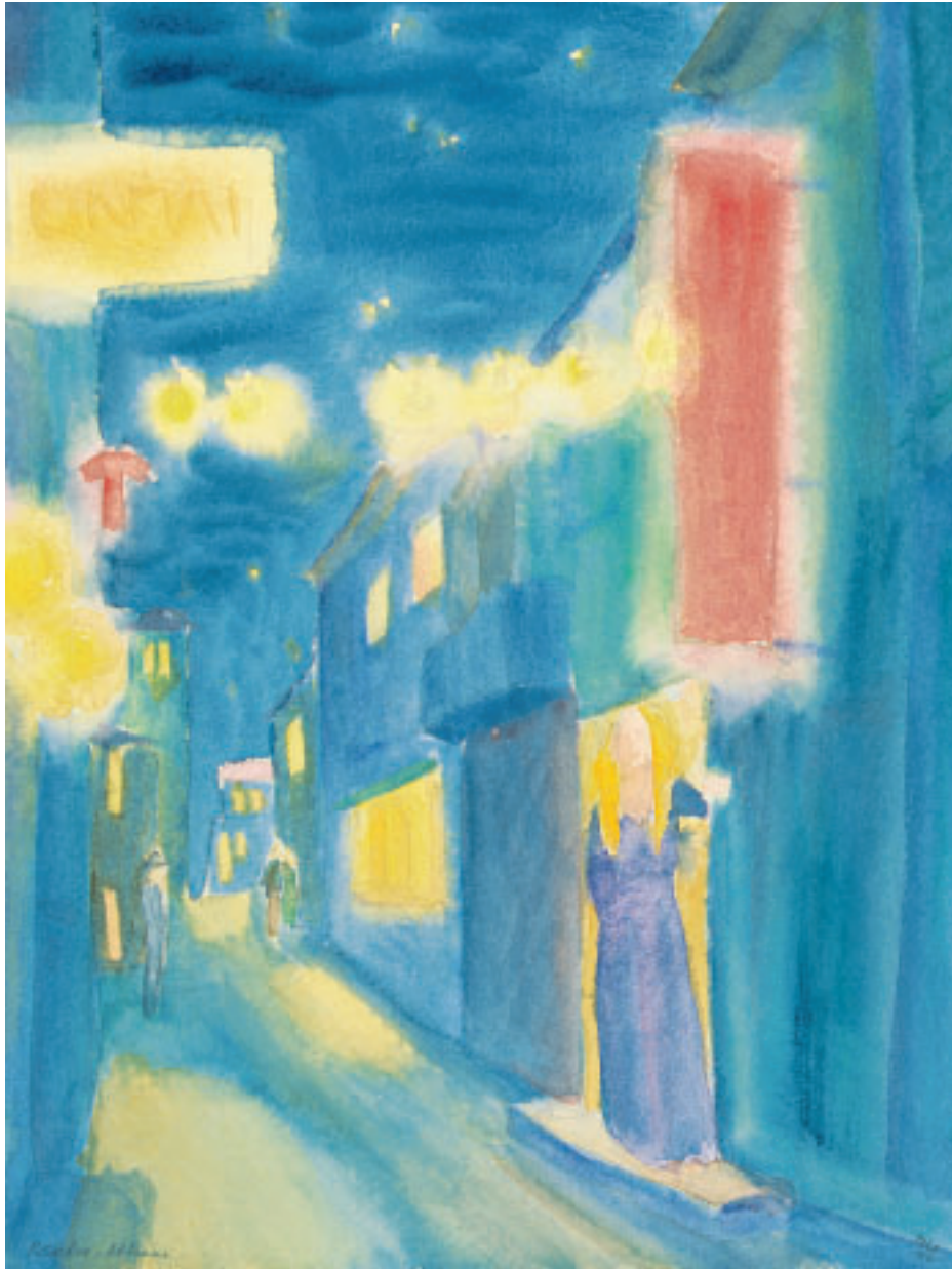
„Nacht in Athen II“, Aquarell, 50 x 39 cm, 1978