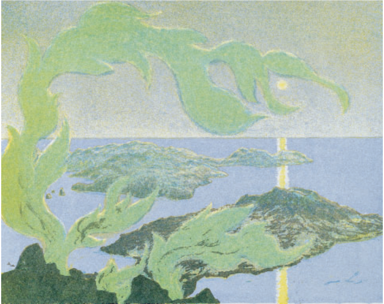
„Vision Schwefelschwaden Mte. Vulcano“ (Liparische Inseln), Lithographie, 26,5 x 33,5 cm, 1987