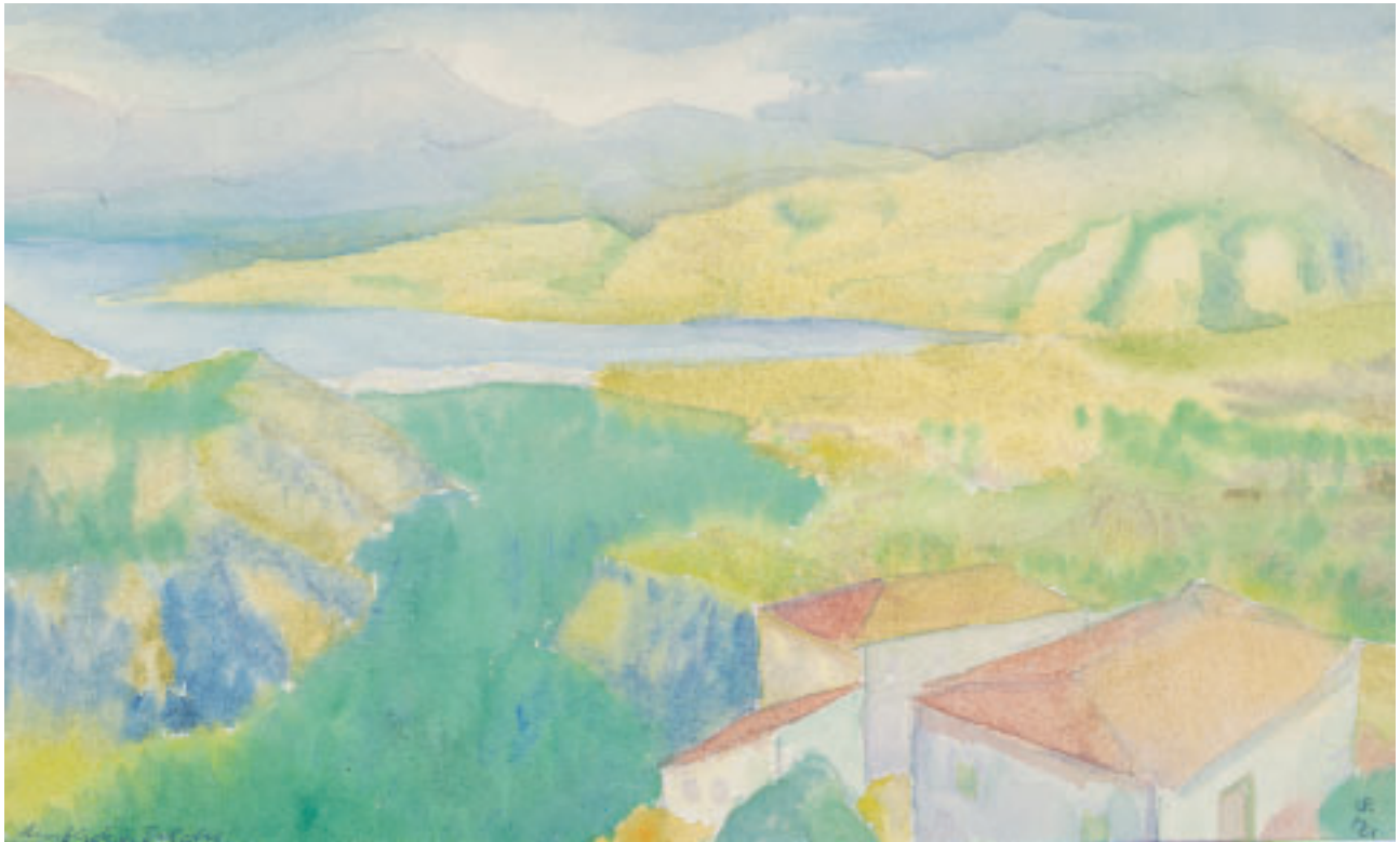
„Ausblick von Delphi“, Aquarell, 20 x 29 cm, 1972