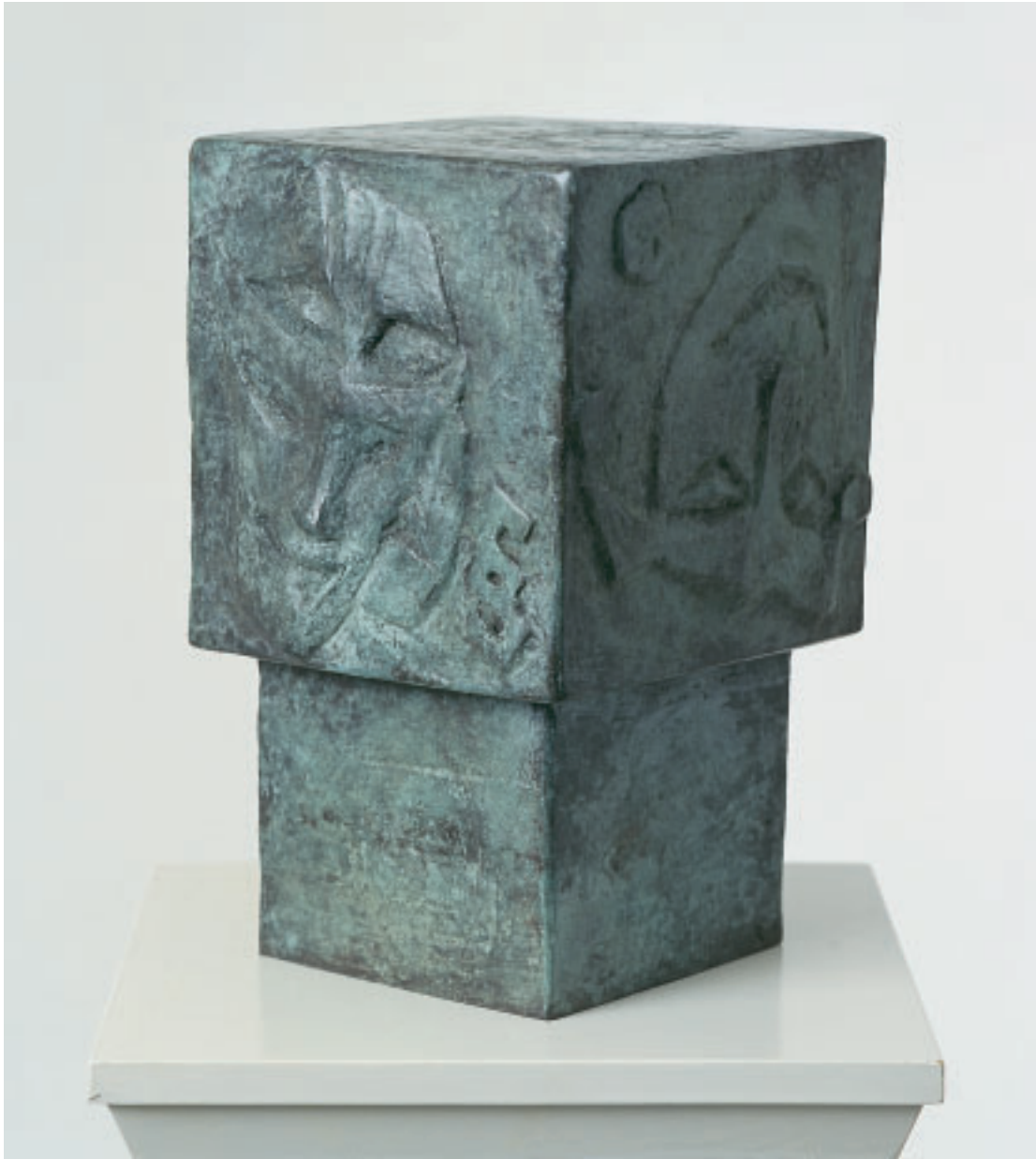
„Das Urteil“, Bronze, 25 x 15 x 15 cm, 1994