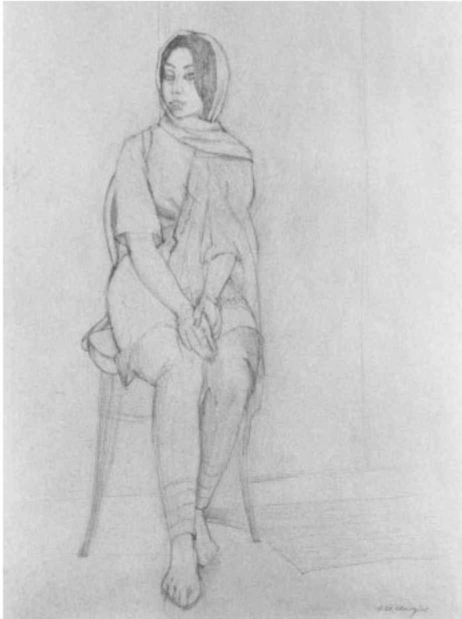
„Pakistanerin I“, Bleistiftzeichnung, 50 x 40 cm, 1972