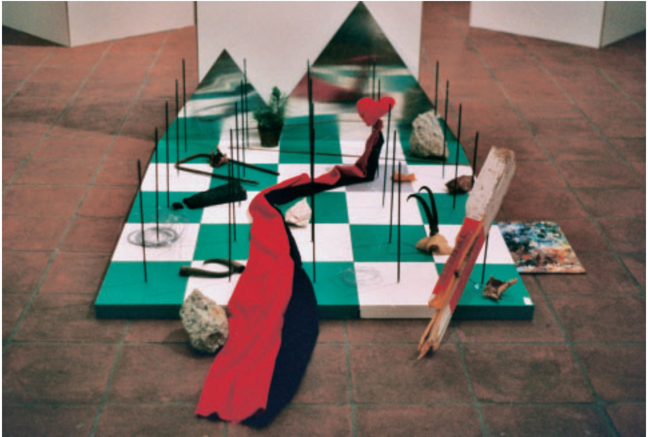
„Grimmselach“, Installation, 125 x 125 x 60 cm, 1995