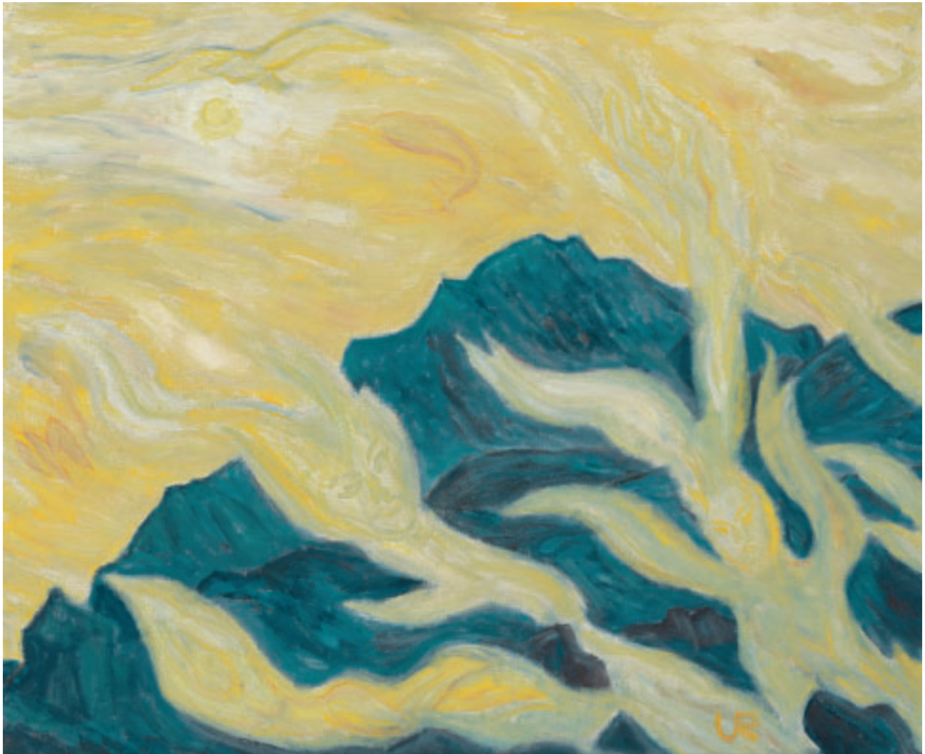
„Vision Schwefelschwaden Mte. Vulcano II “ (Liparische Inseln), Öl, 50 x 61 cm, 1981