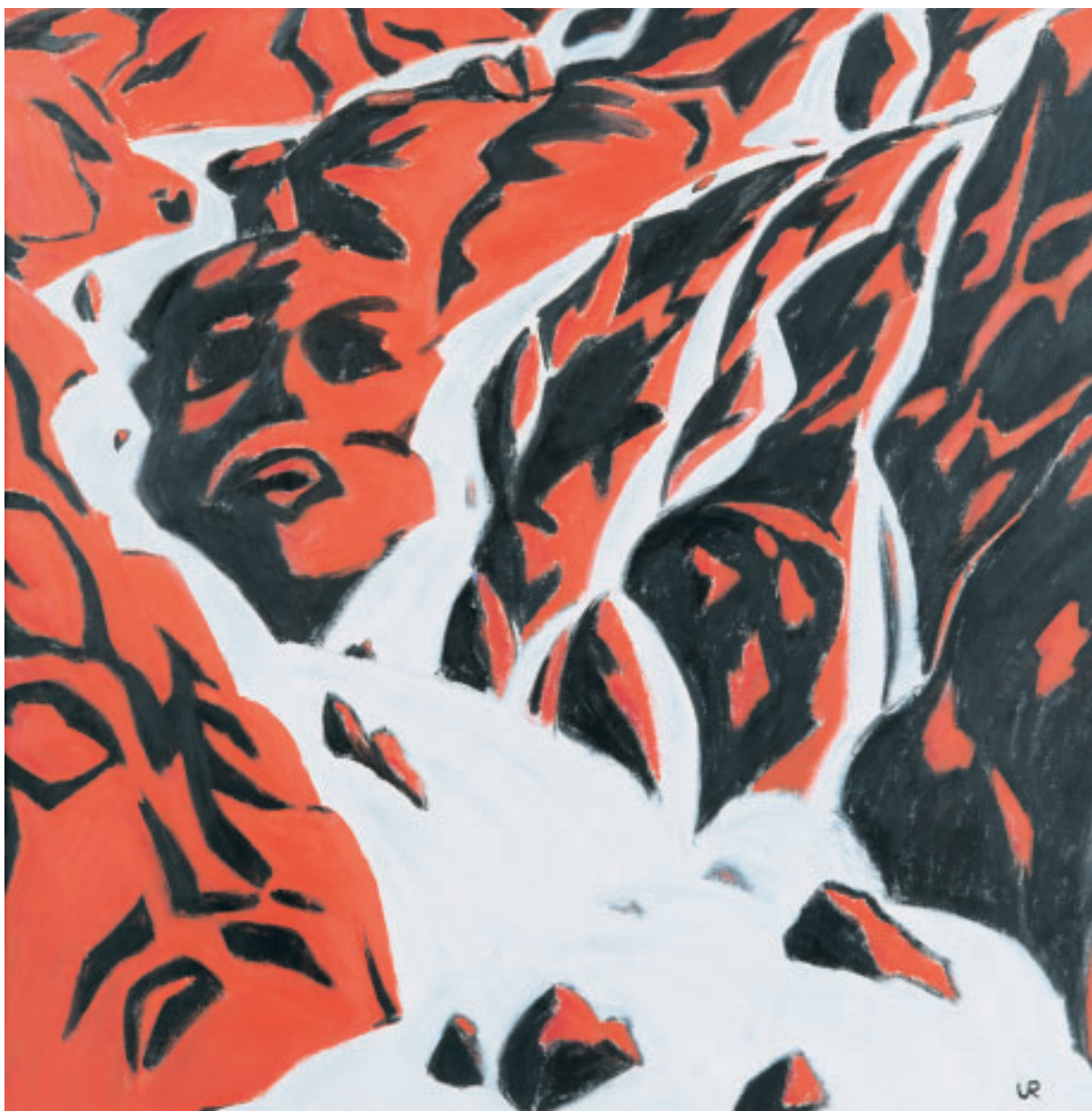
„Silberquell IV“, (Grimselfpass), Acryl, 100 x 100 cm, 1995