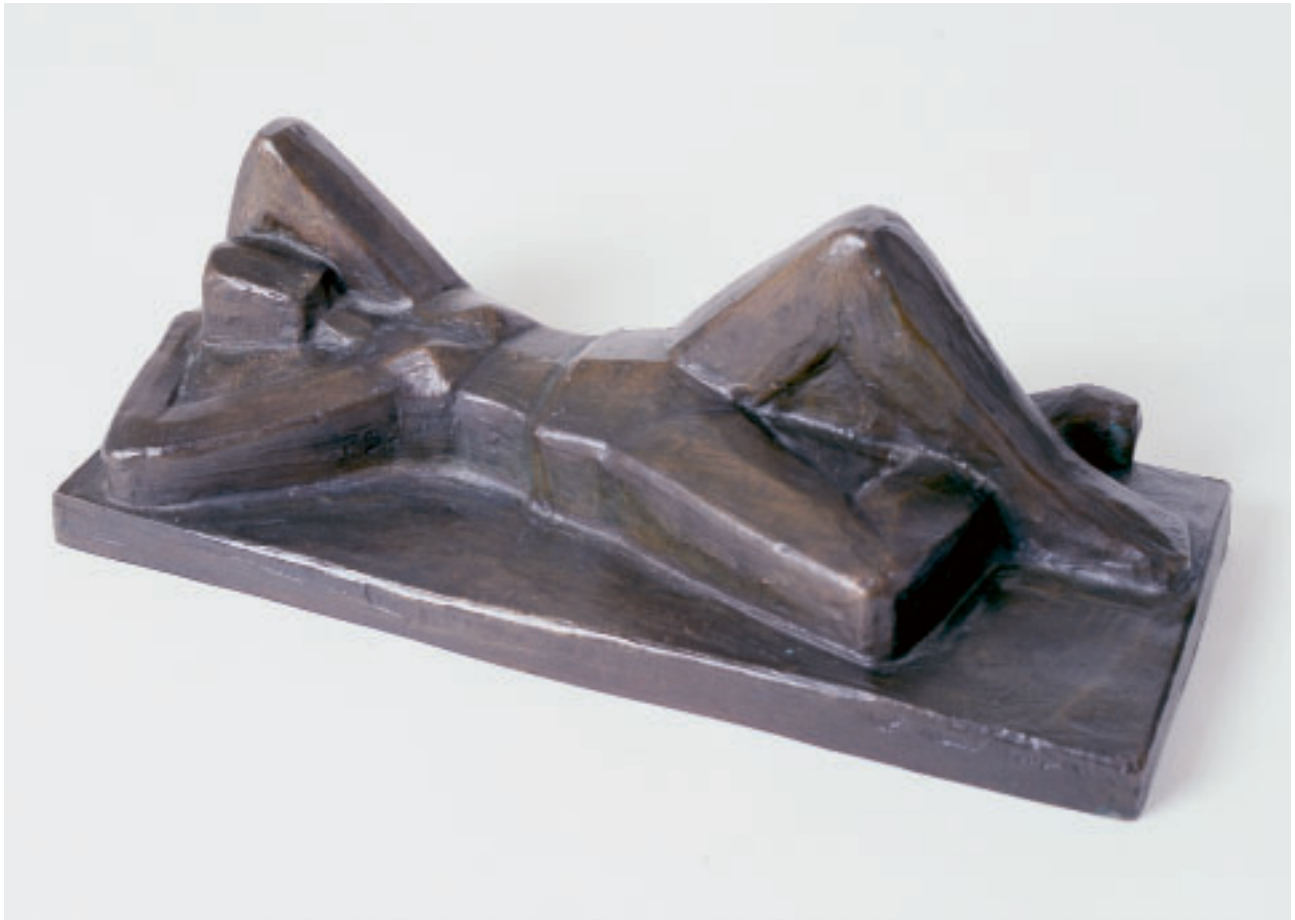
„Liegende Frau“, Bronze, 17 x 48 x 22 cm, 1994