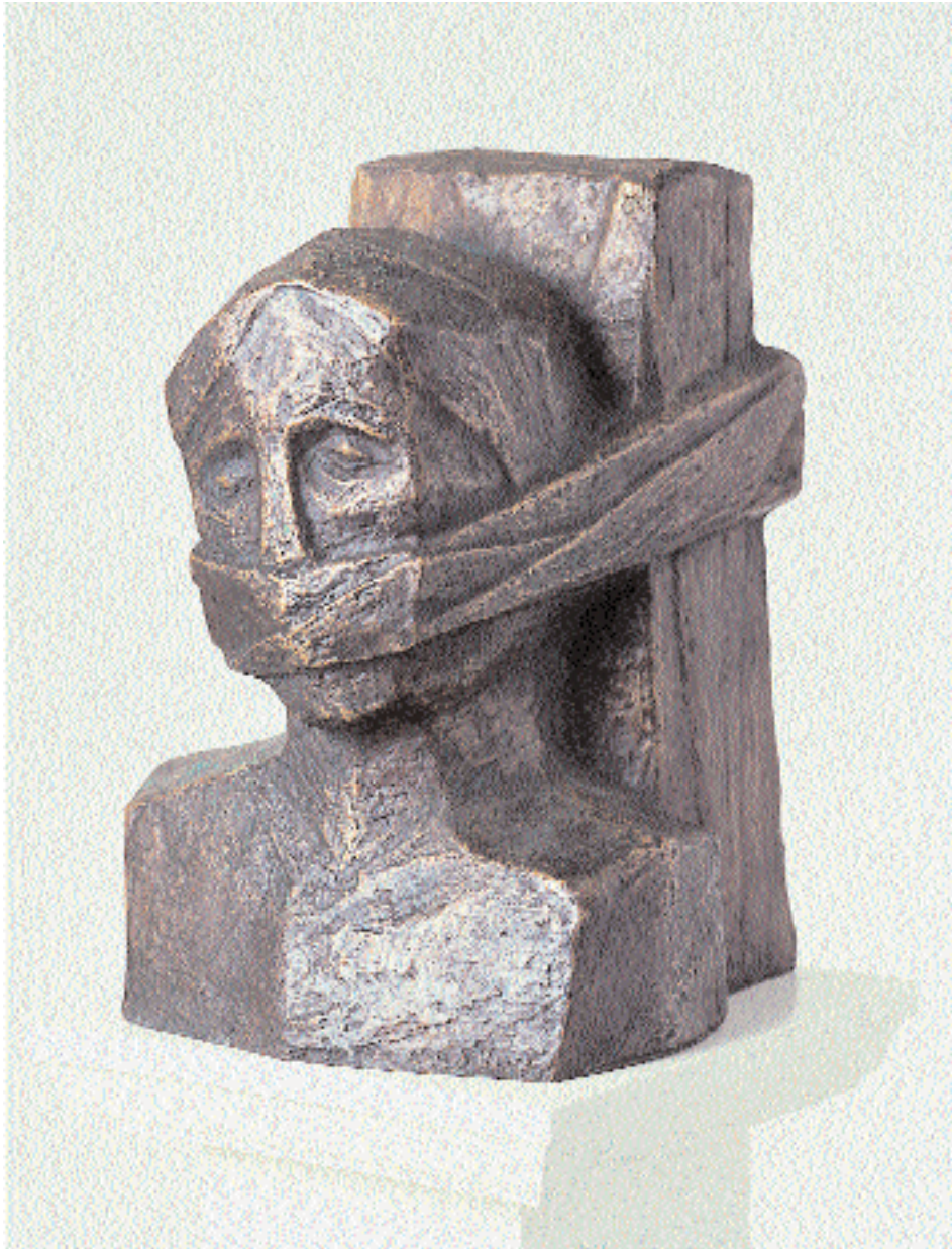
„Die Wahrheit“, Bronze, 22 x 18 x 34 cm, 1994