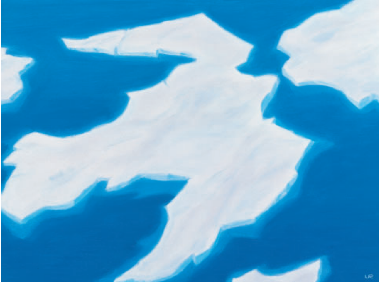
„Silbereis II“, (Grimsepass), Öl, 54 x 73 cm, 2000