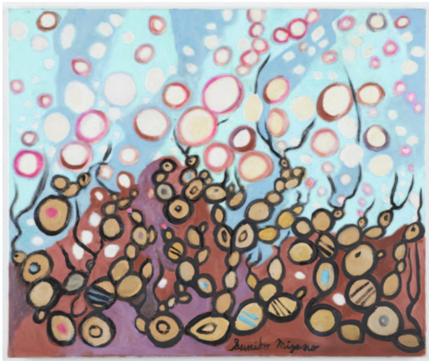
„World of microorganisms (yeast) №36“, oil on canvas, 60,6 x 72,7 cm