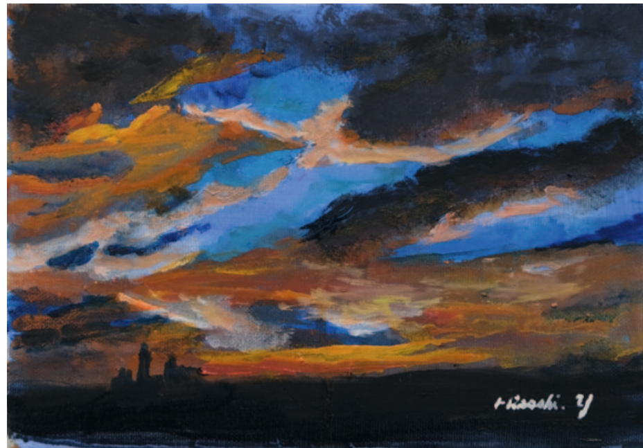
„Le repos No.9“, oil on canvas, 15,8 x 22,7 cm