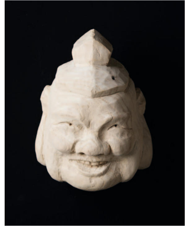
„Ebisu“, wood, 20 x 12 x 3 cm