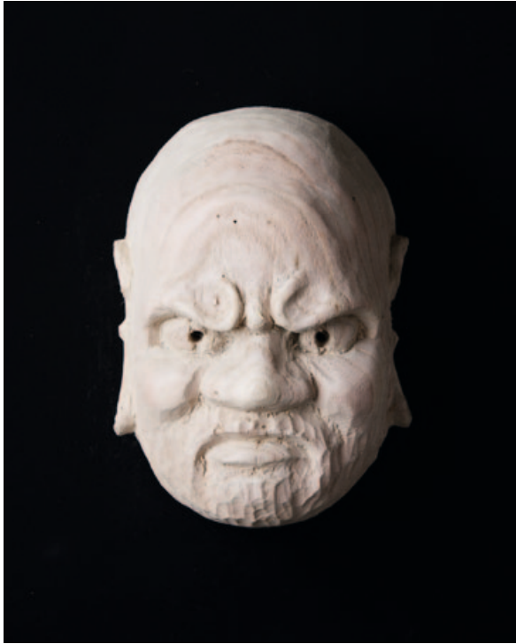
„Darumadaishi“, wood, 20 x 12 x 3 cm