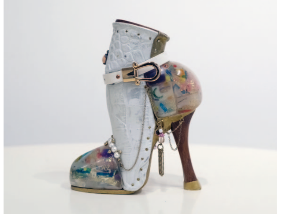
„Angel heels“, polyester, wood, acrylic, 17 x 13 x 6,5 cm