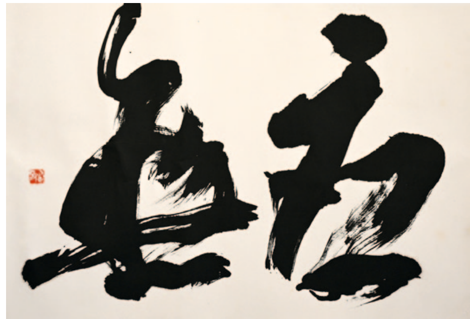
„Omu: Zen terminology. Approach everything with an unattached mind.“ India ink on Japanese paper, 52,5 x 71,5 cm