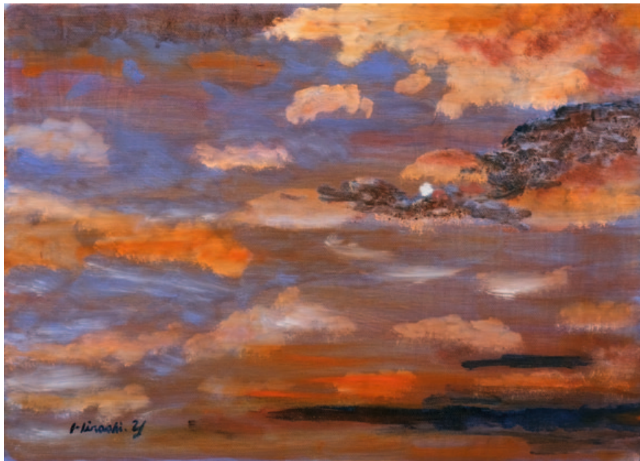
„Le repos No.11“, oil on canvas, 24,3 x 33,4 cm