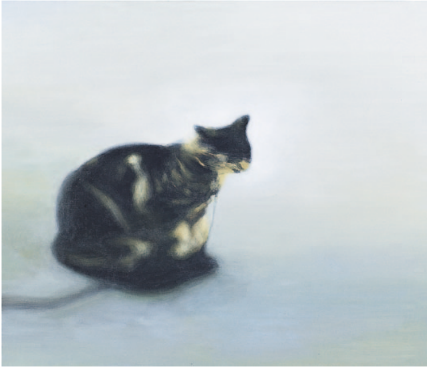
„On a clear day 06“, acrylics on canvas, 45,6 x 53 cm