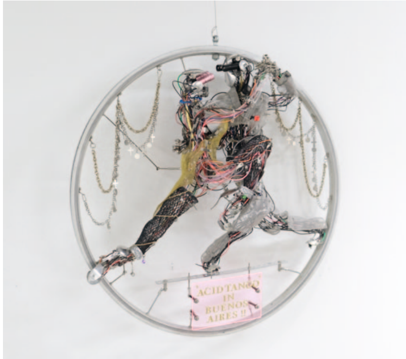
„Acid tango“, iron, aluminum, stainless steel, 57 x 57 cm

SHINSUKE KIKUCHI, born in Aomori, Japan.