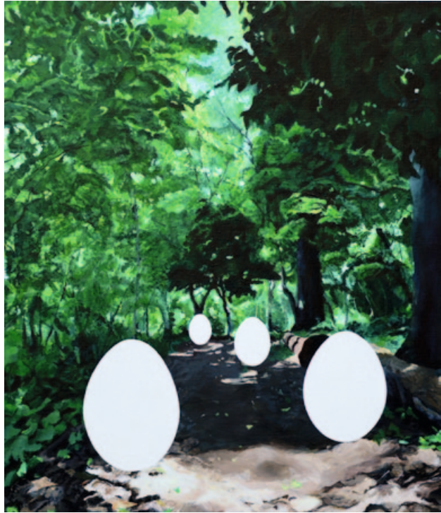
„Déjà-vu-poetry of wanderer 2023#4“, acrylics on canvas, 53 x 45,5 cm