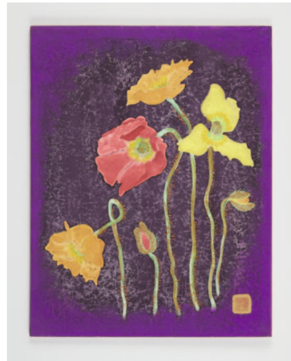
„Gubijin grass“, giclee print, 28,5 x 22 cm