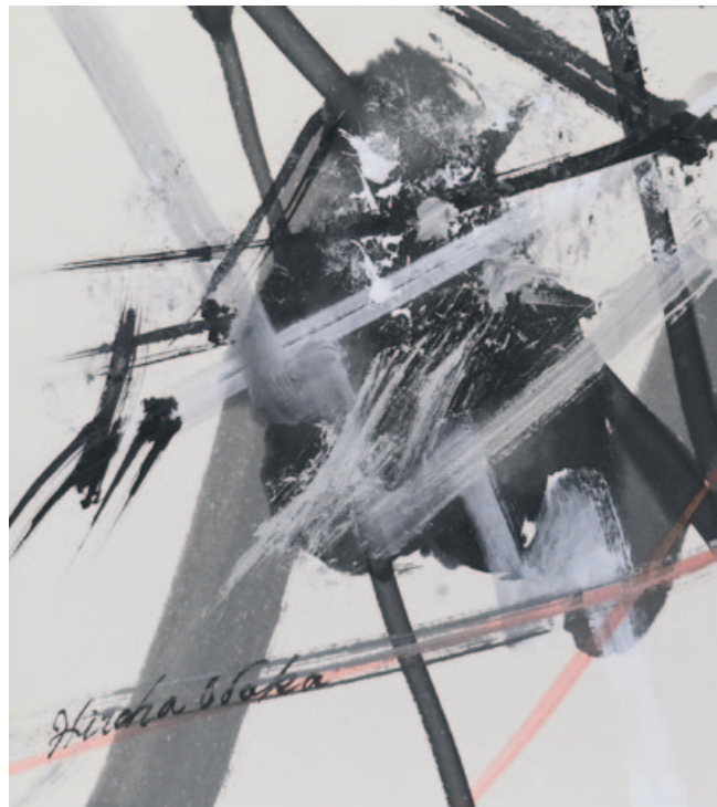
„Move II“, India ink, Japanese paper, 26,3 x 23,3 cm