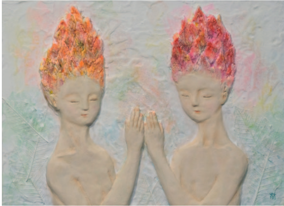
„Plumed cockscomb sister“, stone powder clay, acryl, 24,3 x 33,4 cm