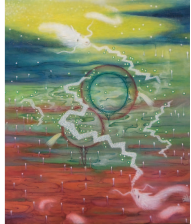
„Sigh stairs“, oil on canvas, 45,5 x 37,9 cm