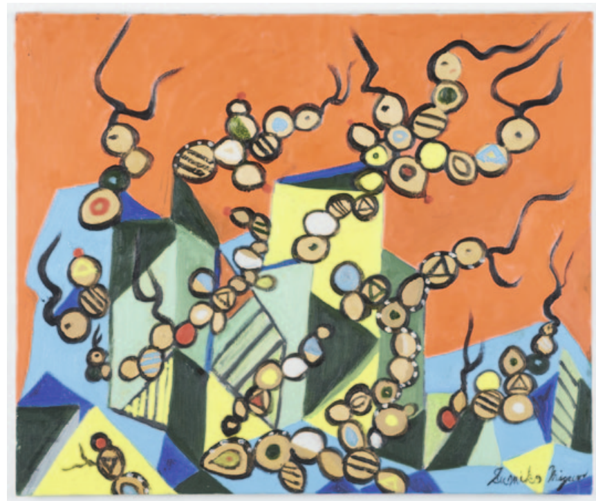
„World of microorganisms (yeast) №31“, oil on canvas, 60,6 x 72,7 cm