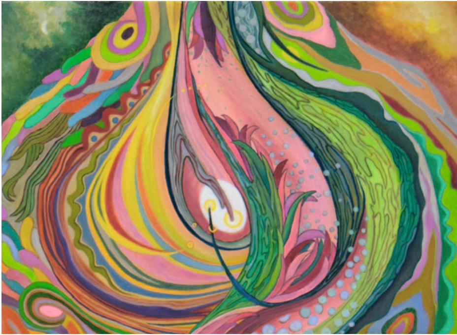
„Tingling“, oil on canvas, 24,3 x 33,4 cm