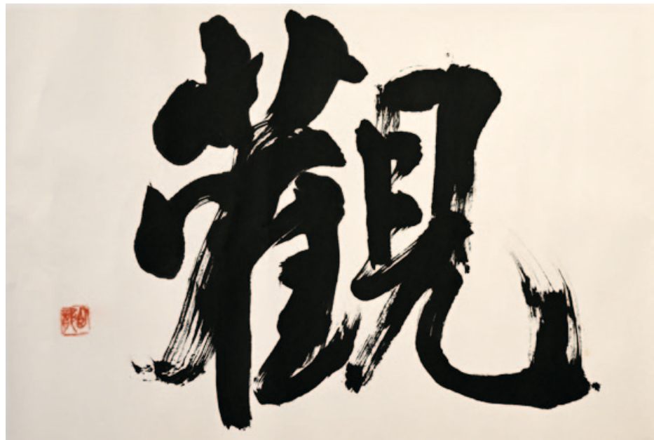
„Kan: Rather than seeing things unconsciously, it is about discerning the object.“ India ink on Japanese paper, 54,5 x 68,5 cm