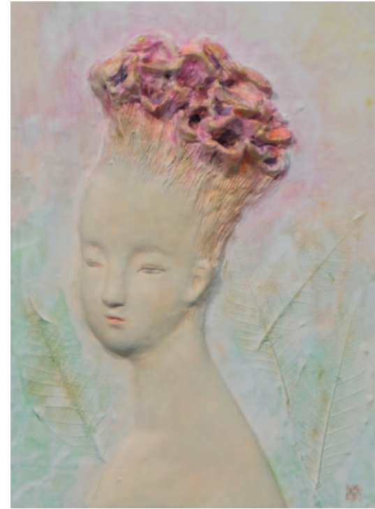
„Plumed cockscomb“, stone powder clay, acryl, 22,7 x 15,8 cm