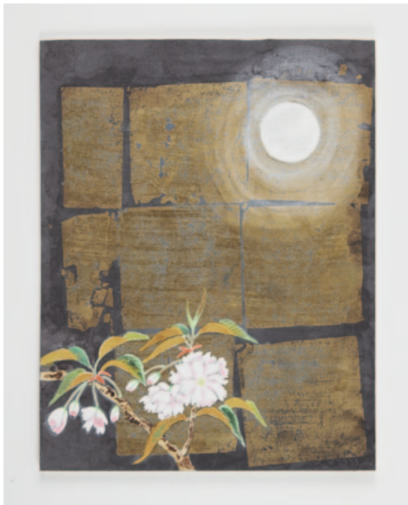
„Hazy moon“, giclee print, 28,5 x 22 cm