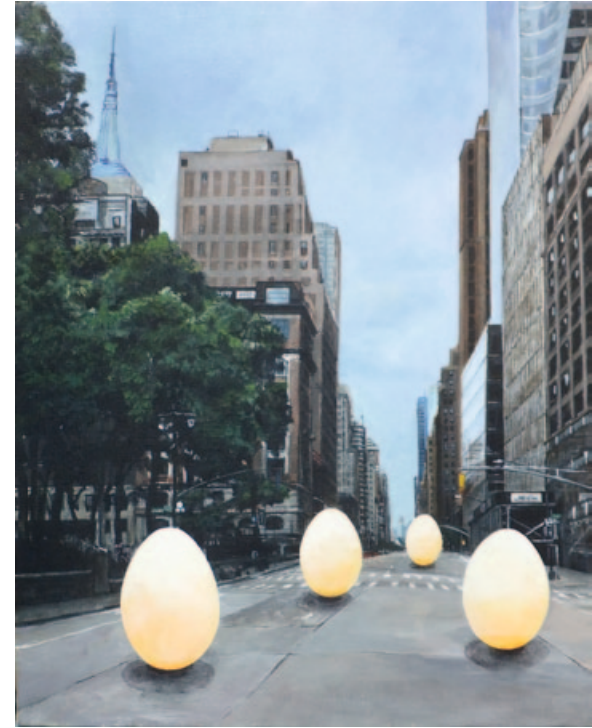
„Déjà-vu-poetry of wanderer 2017#6“, acrylics on canvas, 45,5 x 38 cm