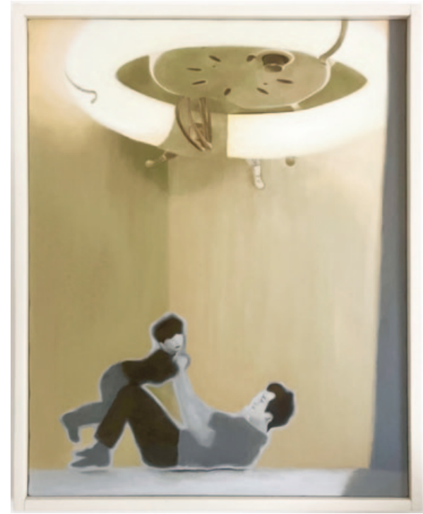
„UsedUFO“, acrylics on canvas, 53 x 45,6 cm